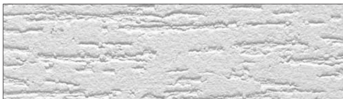
Faktura drapana, grubość ziarna 1,5 mm