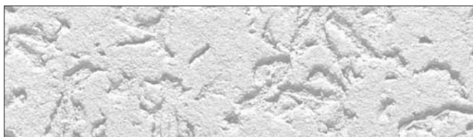
Faktura mieszana, grubość ziarna 2,5 mm