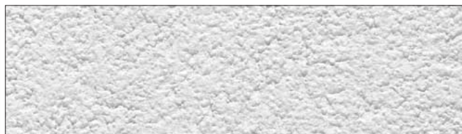
Faktura pełna, grubość ziarna 1,5 mm