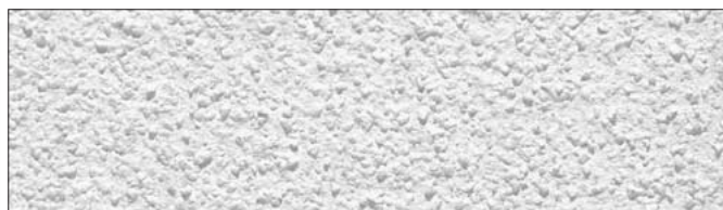
Faktura pełna natryskowa, grubość ziarna 1,5 mm

Uwaga: Powyżej przedstawiono przykładowe faktury mas tynkarskich, które dostępne są w szerokiej gamie uziarnień. Szczegółowe informacje zawierają karty katalogowe poszczególnych produktów. Odchylenia od oryginału mogą być spowodowane techniką druku. Dokładne ustalenie faktur i uziarnienia powinno być dokonane na podstawie wzornika Kolekcja faktur i uziarnienia mas tynkarskich Farby KABE oddanego do dyspozycji Państwa w punktach sprzedaży.