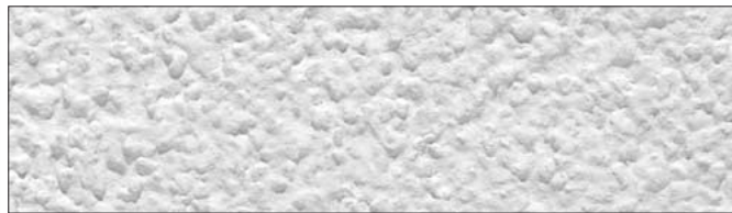
Faktura pełna, grubość ziarna 2,5 mm