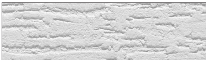
Faktura drapana, grubość ziarna 2,0 mm