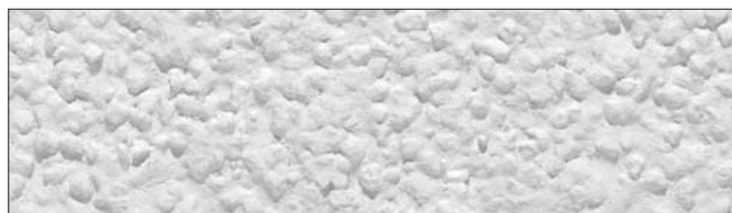
Faktura pełna, grubość ziarna 3,0 mm