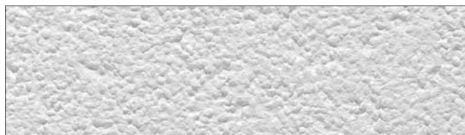
Faktura pełna, grubość ziarna 2,0 mm